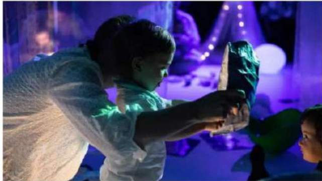
La instalación 'Flow', de L'Autèntica Teatre CEDIJA

El Autèntica Teatre apuesta por la oferta teatral para la primera infancia con tres producciones propias este verano: Colores , Soy naturaleza y Flow , dos de los cuales son estrenos. Esta sala se ha especializado en el público de 0 a 6 años, unos espectadores "muy exigentes" y "un reto creativo".