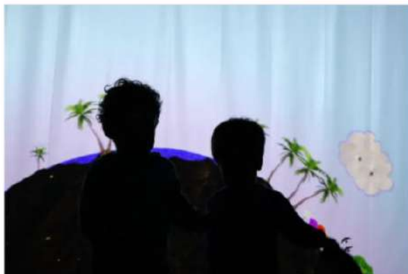
Fibita para los más pequeños: se estrena (Oh, uh, ah, el Tierra-Aire-Fuego-Agua, una instalación audiovisual para niños de 1 a 5 años