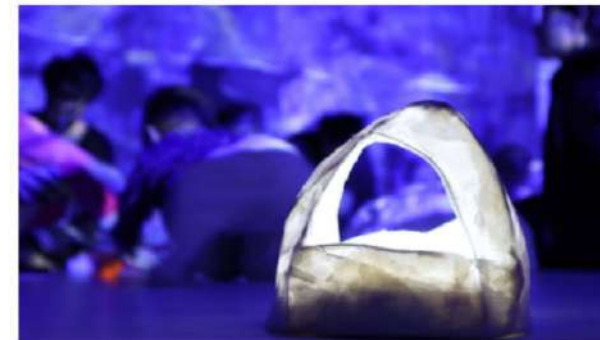
Un momento de 'Sóc natura', una sala interactiva que simula un día en el bosque.

La sala también ha participado en diferentes concursos y festivales, de hecho Sóc natura se presentará a nivel europeo en un ciclo de teatro en los Países Bajos. Asimismo, la sala acoge a diferentes compañías de otras comunidades autónomas, "normalmente vienen de Valencia o las Islas Baleares", expresa la directora de L'Autèntica. De esta manera y entre los espectáculos de compañías invitadas, destacan los del conjunto Titelles Pam i Pipa, dedicado especialmente a la transmisión de la cultura catalana a través de canciones populares, que traerá El lleó no em fa por , Cargol treu banya , y Tirolilo .