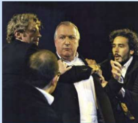
Escena de l'obra que ha estrenat aquest dijous L'autèntica.